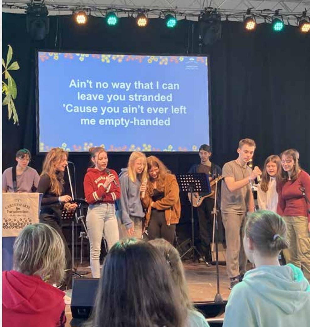
TEN SINGer beim Proben für die Abschluss-Show