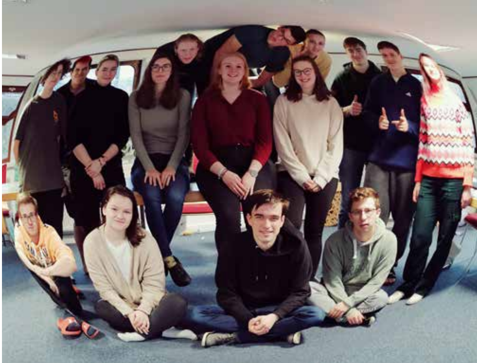
FSJ-Seminargruppe im Salon Dresden auf dem CVJM-Schiff