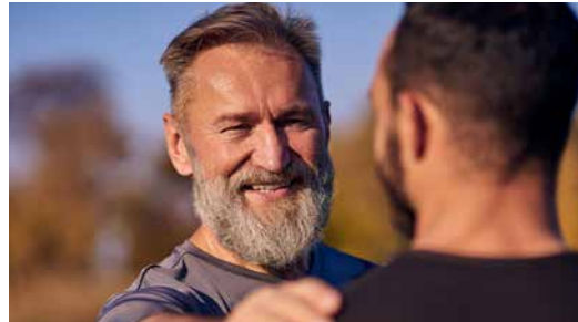
Zu jung?! 6