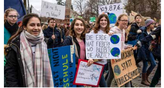
Lernen von George und Greta 8