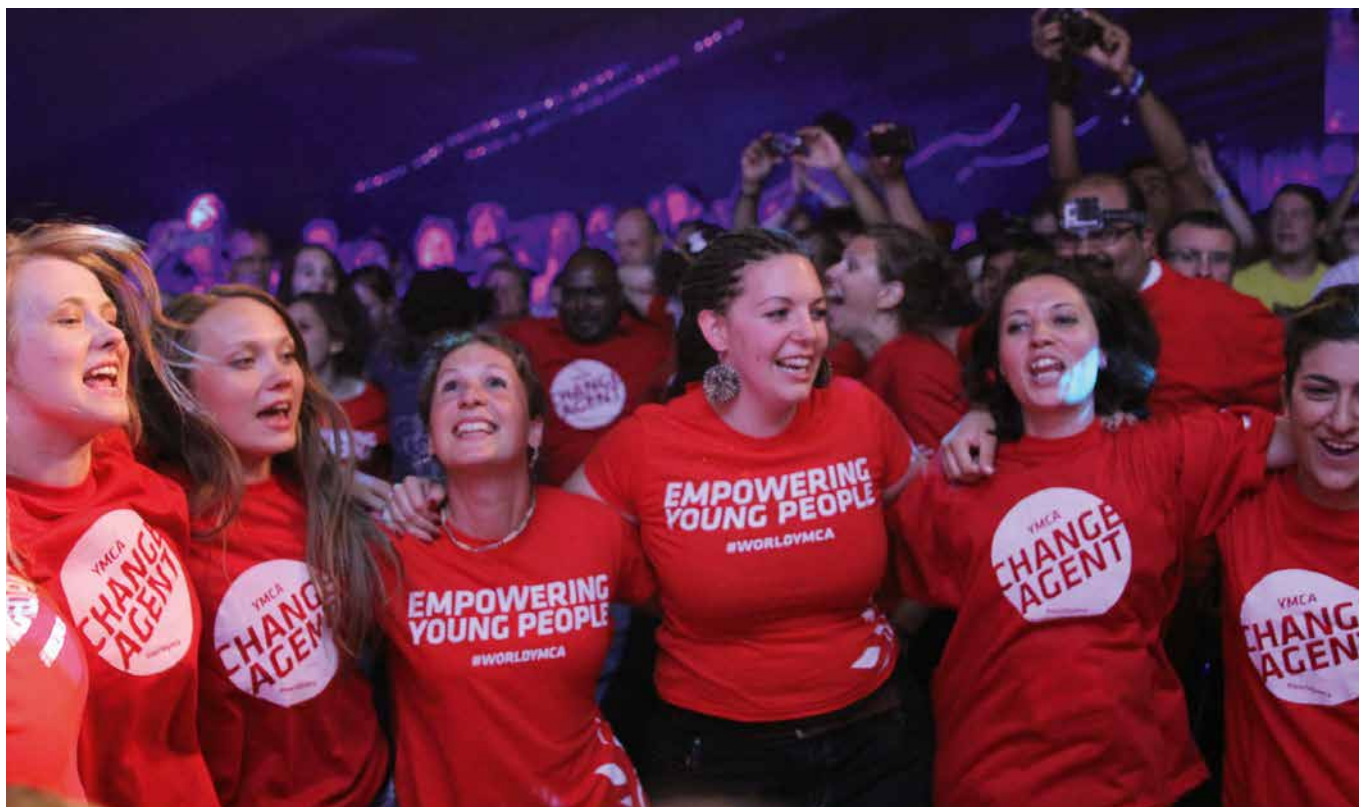
Die erste Generation der Change Agents bei der Weltratstagung 2014 in Estes Park, Colorado

► Ist es nicht toll zu sehen, dass CVJM-Arbeit oft an der Spitze neuer Bewegungen und Innovationen steht? Kein Wunder, denn beseelte und mündige junge Menschen sind die treibende Kraft unserer Arbeit. Sie sind ein Strang der oft beschworenen »CVJM-DNA«.