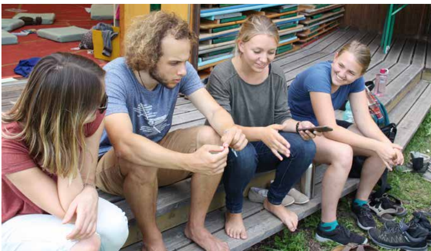
Ehemalige internationale Freiwillige treffen sich beim »Homebase« auf dem Himmelsfels bei Kassel zum Austausch

Am Anfang steht ein Traum und am Ende das Loslassen des Traumes, weil er einem nicht gehört. Es sind die Nächsten, die ihn jetzt träumen und umsetzen: auf ihre Weise.