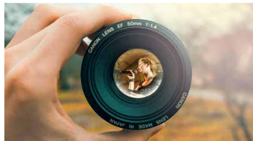
Young Leaders im CVJM 15