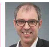
Tobias Faix Professor an der CVJM-Hochschule

Mentoring sucht nicht die große Bühne, sondern ist eher die leise Revolution, die versucht das Potenzial Gottes in uns Menschen Stück für Stück zu entfalten.