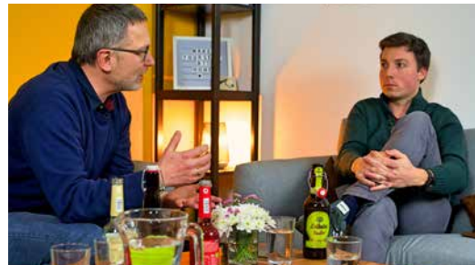
Bestimmer oder Diener 10